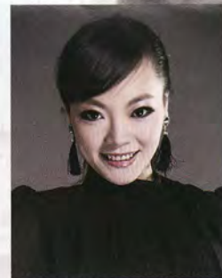
ソプラノ 李奕霄 Li Yixiao